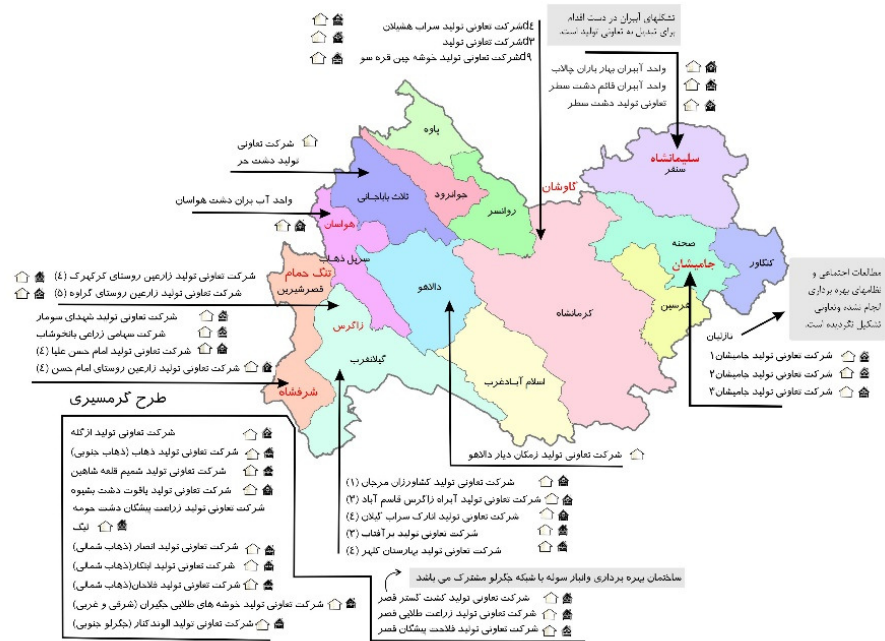
شکل ۲. وضعیت انبار و ساختمان های احداثی بهره برداری شبکه های آبیاری تحت پوشش تعاونی های تولید در استان کرمانشاه

مطالعه پیش رو به منظور شناخت عوامل مثبت و منفی در مدیریت بهره برداری از شبکه های آبیاری استان کرمانشاه و با استفاده از روش های ارزیابی مشارکتی روستایی PRA و همچنین مدل SWOT انجام شد. PRA نشان دهنده گروهی از رویکردها و روش هایی است که جامعه یک روستا را ترغیب می کند تا ضمن بالا بردن دانش خود، فعالانه در تجزیه و تحلیل مسائل و مشکلات جامعه خود مشارکت کنند. استفاده از تجربیات جامعه به ویژه طبقه حاشیه ای مانند زنان، کشاورزان و کودکان در تسهیل توسعه بسیار مهم است و باید به نظرات آن ها گوش داد و شکایات، تجربیات زندگی، امیدها و توانایی های تجزیه و تحلیل آن ها را شنید. این امر در خلال جلسات و گردهمایی های انجام شده در روستاهای محدوده مطالعاتی بعد از گفتگوهای مفصل و طولانی و ارائه توضیحات از سوی تسهیلگران اجتماعی پروژه احداث شبکه فرعی آبیاری انجام شد.