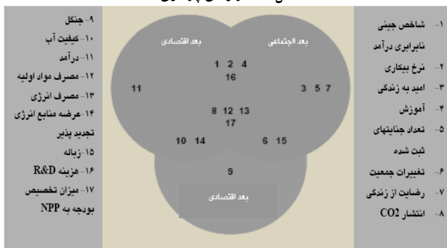
شکل ۲- معیارهای پایداری