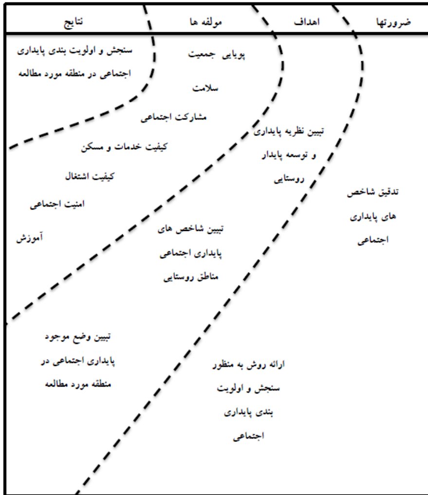
شکل ۳- مدل مفهومی و اجرایی پژوهش