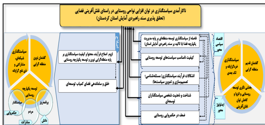
شکل ۲. مدل مفهومی (کدگذاری انتخابی) چالش‌های مؤثر بر توان‌افزایی نواحی روستایی استان کردستان در راستای نقش‌آفرینی در تحقق‌پذیری سند راهبردی آمایش استان

اثر بخشی سیاست‌گذار در راستای اعمال قدرت و تنظیم امور و فرایندها، برنامه‌ریزی مبتنی بر دانش و تخصص و مردم محلی با مشارکت، لازمه حرکت در این مسیر خواهد بود. همچنین به‌واسطه ماهیت چندبخشی و چندوجهی با تعدد بازیگران فرایند سیاست‌گذاری، توسعه منطقه‌ای با ماهیت فضایی و توسعه روستایی و ترسیم الگوی روابط درونی مقوله‌ها نشان از روابط درهم‌تنیده و ارتباطات متقابل آن‌ها دارد. بر این مینا حرکت در مسیر ساماندهی فضای توسعه‌ای و ایجاد توسعه منطقه‌ای پایدار در فضای جغرافیایی آن به‌عنوان هدف نهایی سند راهبردی آمایش استان، نیازمند دید سیستمی و مدیریت یکپارچه و هم‌افزا در ساختار و فرایند سیاست‌گذاری توسعه‌ای است.